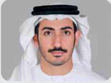
سمو الشيخ/ محمد بن سلطان بن خليفة آل نهيان نائب رئيس مجلس الإدارة