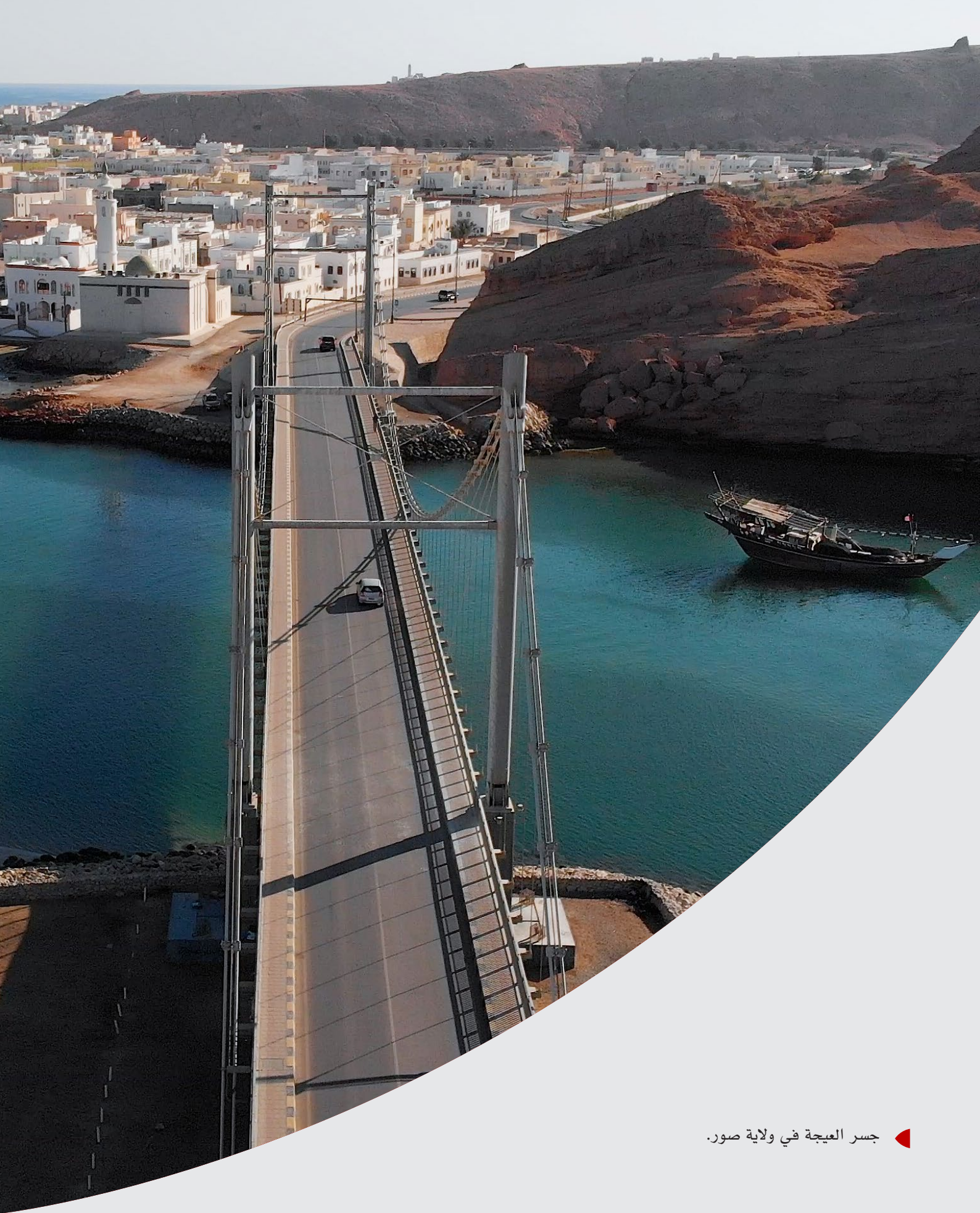
◀ جسر العيجة في ولاية صور.