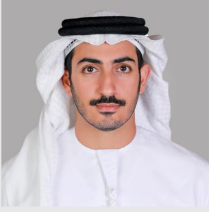
سمو الشيخ/ محمد بن سلطان بن خليفة آل نهيان نائب رئيس مجلس الإدارة