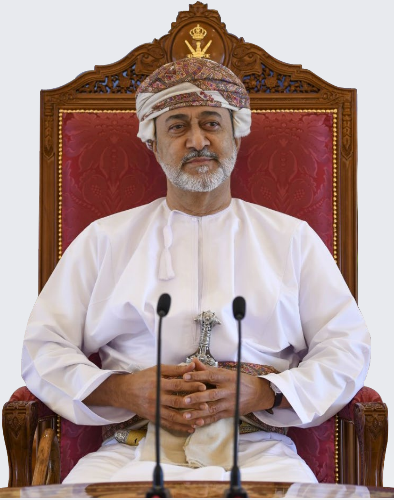
حضرة صاحب الجلالة السلطان هيثم بن طارق